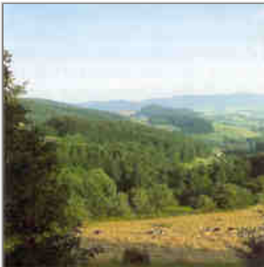
Landschaftspanorama im Odenwald

Die dritte Landschaft bildet das fruchtbare Mainbecken mit dem südlich anschließenden Odenwald (Katzenbuckel, 626 Meter). Dieses Mittelgebirge senkt sich nach Westen ab zur berühmten Bergstraße am Rande der Oberrheinischen Tiefebene. Mainbecken und Bergstraße gehören zu den wärmsten Gebieten Deutschlands. Die anderen genannten Mittelgebirge sind dagegen rau und regenreich.